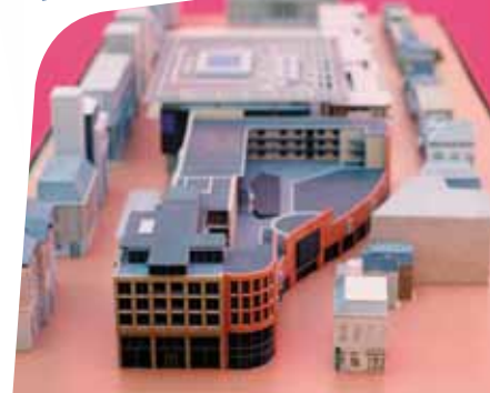
Maquette Winkelcentrum Zaailand

Copini licht alvast een tipje van de sluier op. "Het winkelloppervlak wordt verdubbeld. Naast ons komt The Sting, een winkel van drie etages. Maar ook de Xenos wordt onderdeel van het winkelcentrum. Het centrum is nu al een unieke winkelplek, maar over twee jaar is het écht een begrip in het Noorden."